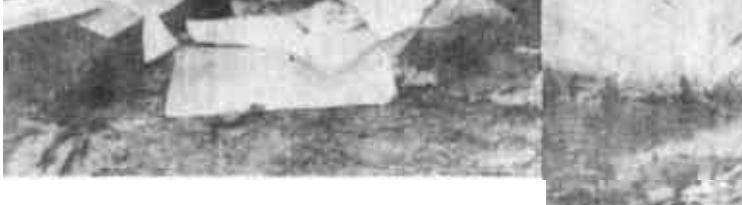
本版责任编辑 黄功霖